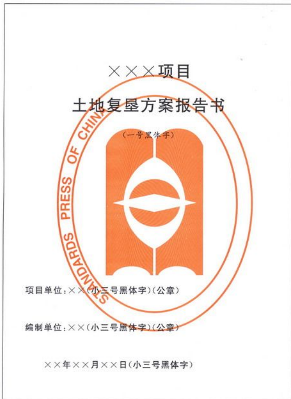
图 A.1 土地复垦方案报告封面格式